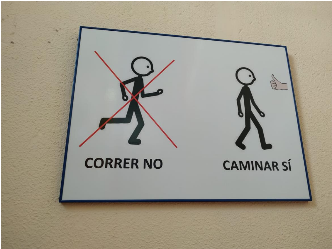
Cuadro ejemplo con Normas de Centro