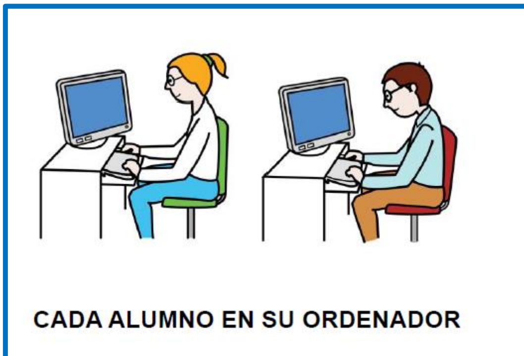
Cuadro ejemplo con Normas de la Sala de Informática