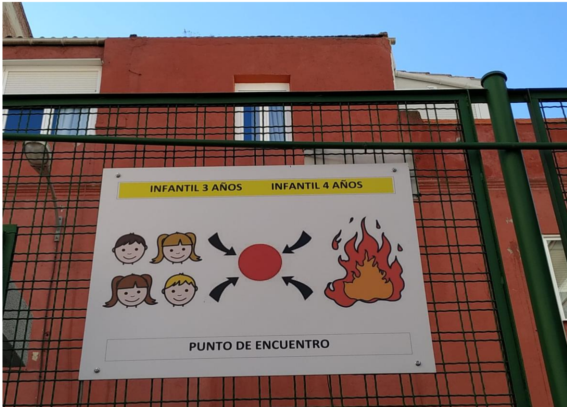
Panel localizador de punto de encuentro Incendios