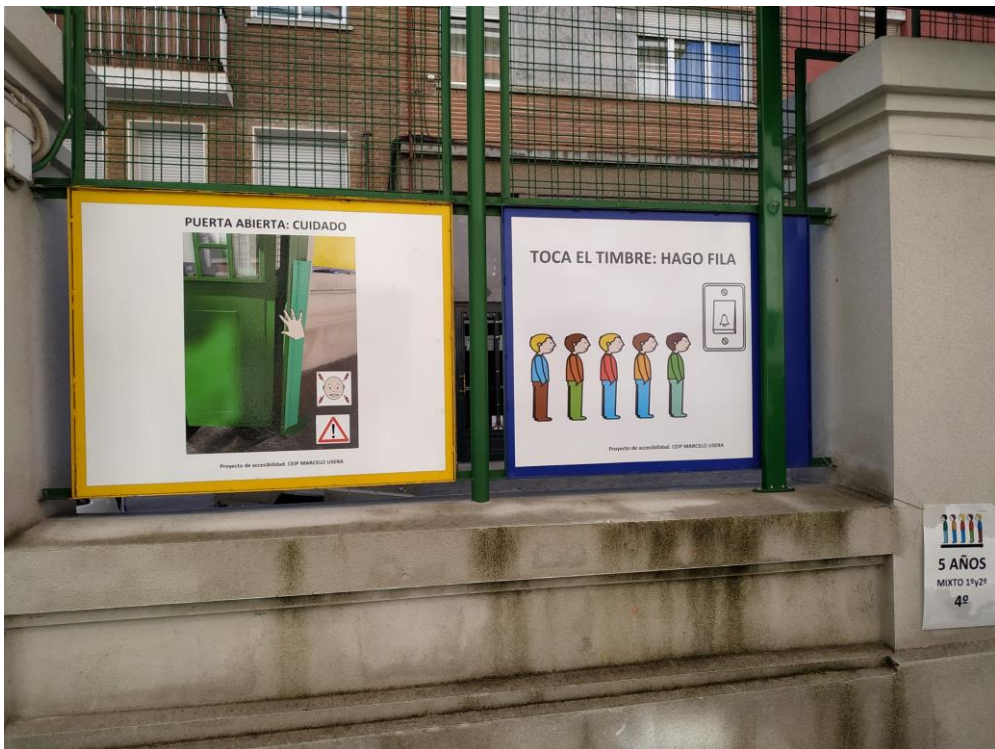
Paneles para anticipar normas de convivencia en el recreo