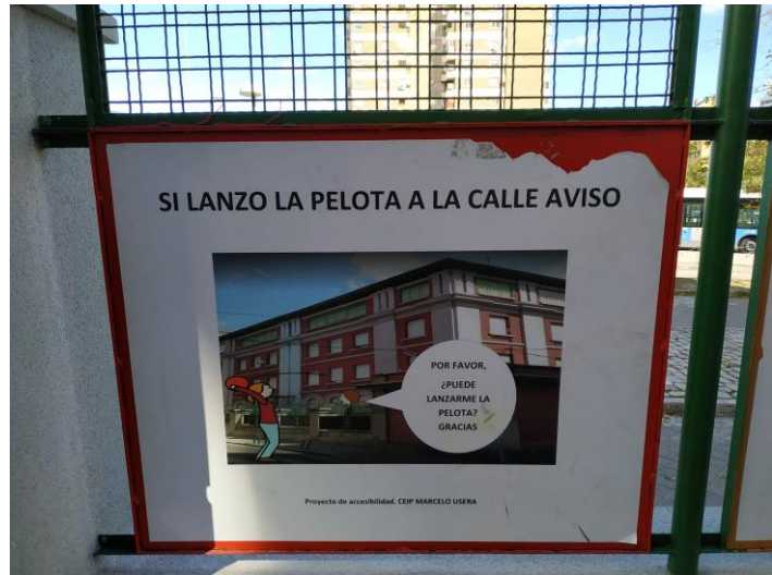
Ejemplo de panel deteriorado a reparar

Dado que en el centro creemos firmemente que estas estrategias de accesibilidad cognitiva favorecen la inclusión y facilitan el bienestar emocional y la participación de todo el alumnado, este curso escolar (tomando como referente el beneficio que hemos observado con las fases anteriores ya realizadas) queremos poder seguir poniendo en marcha el proyecto de Picto-Inclusión, que tan buenos resultados está dando, en una tercera fase.