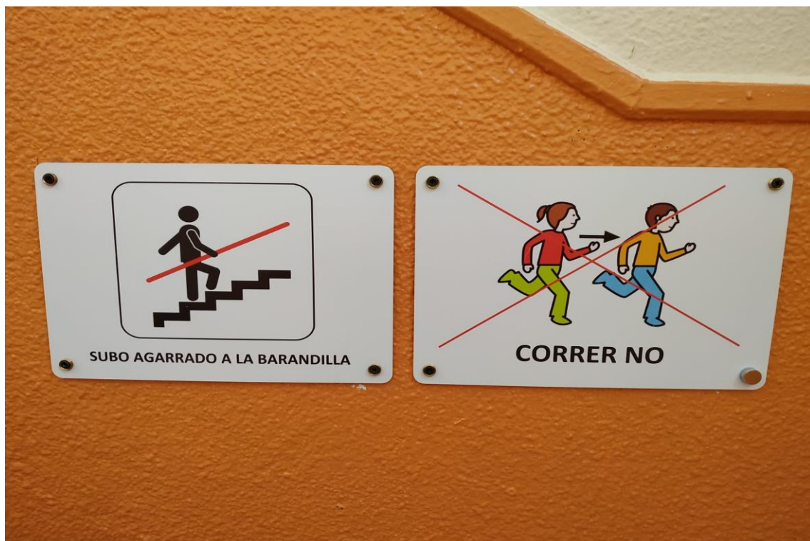
Panel normas de procedimiento para subir/bajar las escaleras