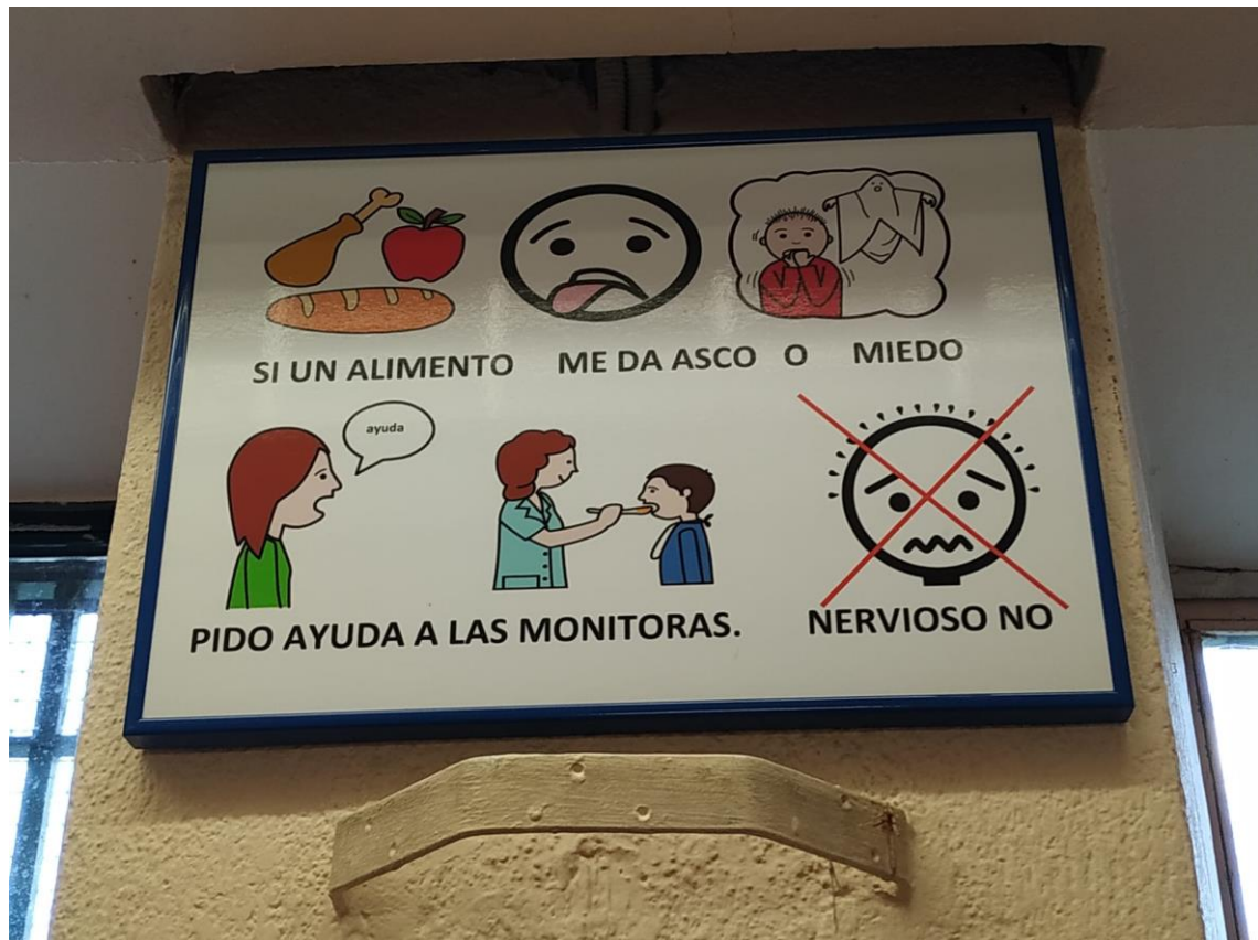
Cuadro ejemplo con Normas de Comedor