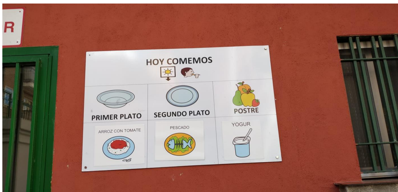
Panel para anticipar el menú escolar

Incorporamos fotos de los materiales que se diseñaron en la FASE I y II del Proyecto de Picto- Inclusión (curso 17-18 y curso 18-19)