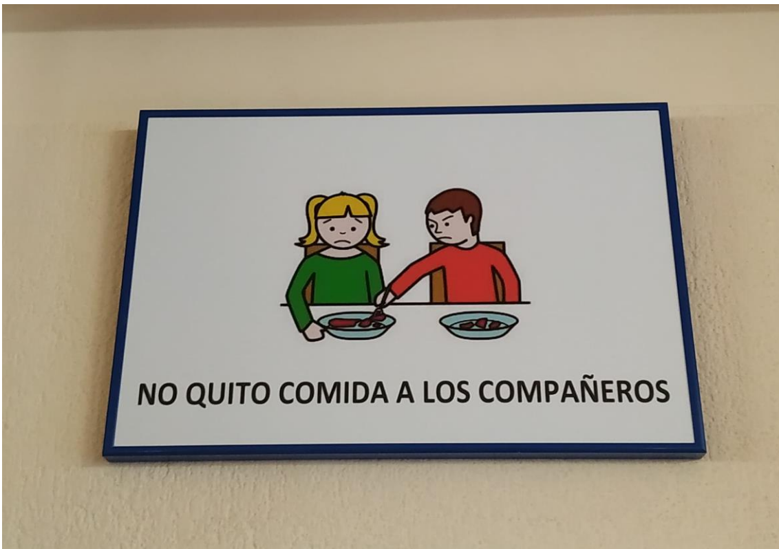
Cuadro ejemplo con Normas de Comedor