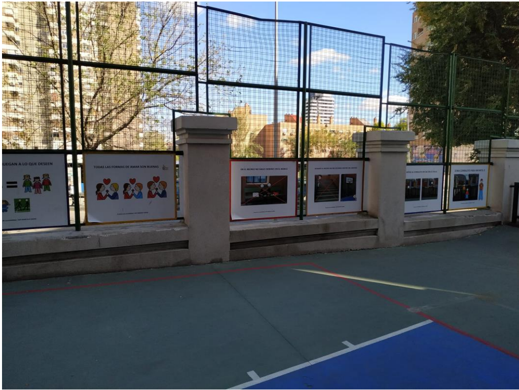
Paneles para anticipar normas de convivencia en el recreo