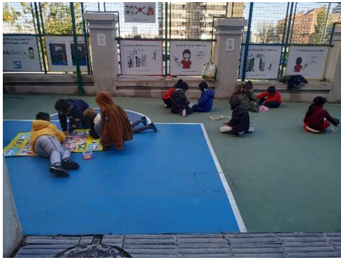
Alumnos de 1º y 2º con juegos.