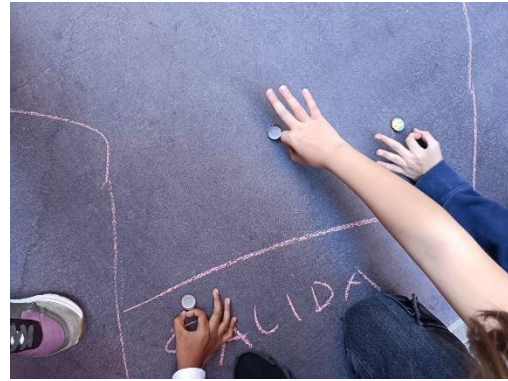
Alumnos del 2º turno en torneo de chapas.